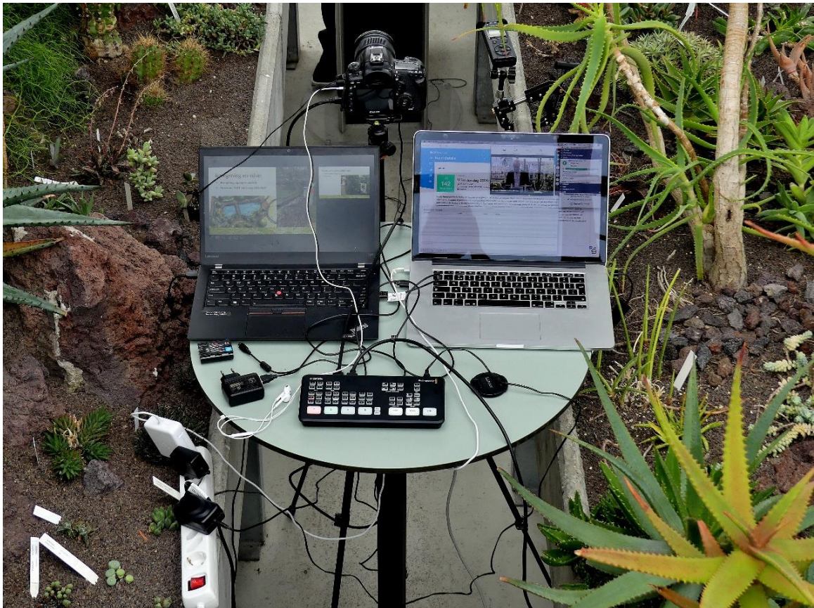
Studio Cactusbalkon met dank aan ons technisch supertrio

Ook met de hand bestoven, met een pink in dit geval, wordt een Thais balsemplantje, een sterk bedreigde soort. Met het zaad dat de bestuiving oplevert, kunnen nieuwe exemplaren worden gekweekt.