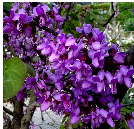
Judasboom Cercis siliquastrum