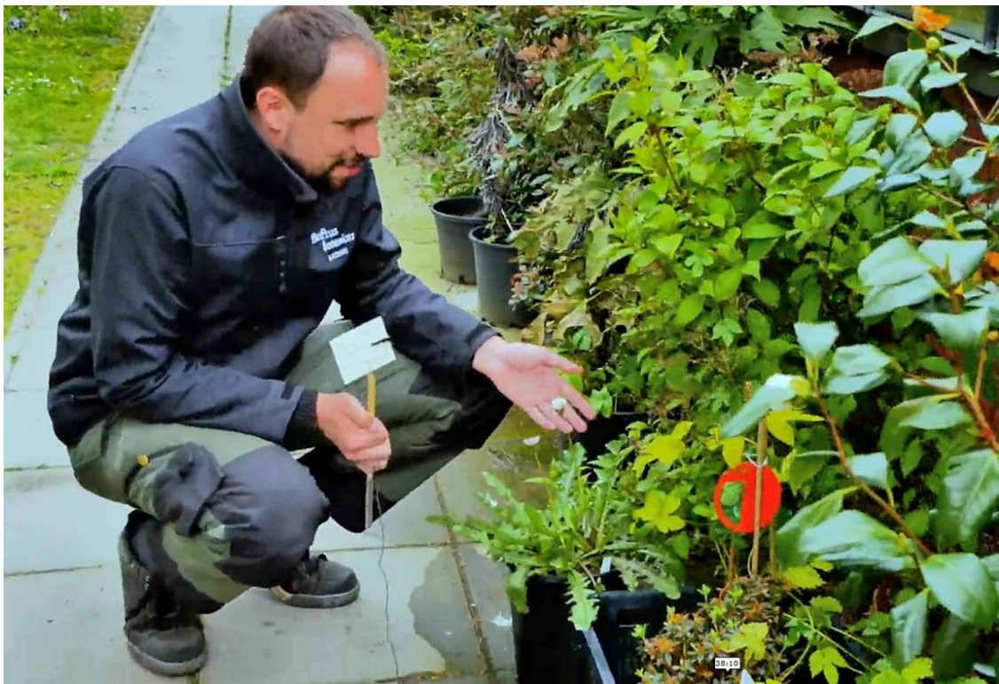
Soms worden stoepplantjes bewust gekweekt, zoals deze paardenbloem. Geen gewone, maar een witte uit Japan.