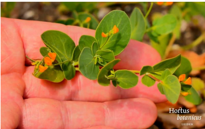
Schorpioenkruid Coronilla scorpioides

Wouter onderhoudt de Clusiustuin. Zijn favoriete plant daarin is de Judasboom, een vlinderbloemige. Eigenlijk wordt een boom snel te groot in de opzet van de Clusiustuin, maar door hem als een soort bonsai te behandelen houdt Wouter hem binnen de perken. Ook een vlinderbloemige, maar dan één die er heel anders uitziet, is het schorpioenkruid, dat Wouter zelf gezaaid heeft in de Clusiustuin.